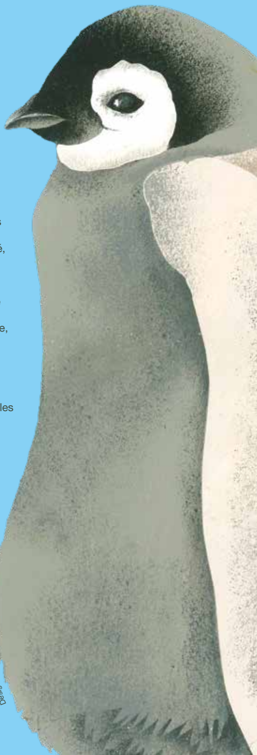
Illustration : Bernadette Gervais agence : udbel